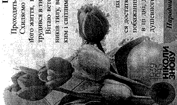
Народний депутат України Олександр МУБЧАН

Нехай у ваших родинах панує злагода, оселі повняться достатком, а всі теніші слова і побажання, які ви почувете в ці дні, додають сил і душевного спокою!