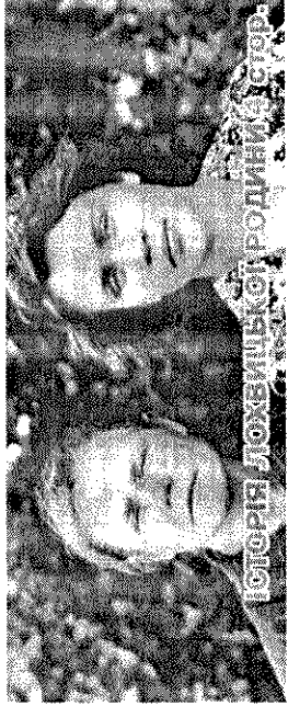
ІСТОРІЯ ЛОХВИЦЬКОПРОДІМНОГО СЕРВ.