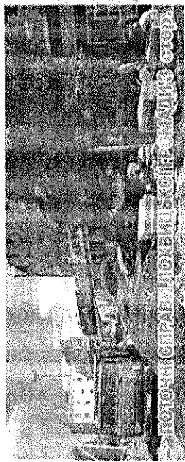
ПОТОКІС ПРАВИЛОХВИЦЬКОПРОМІШЛІС СЕРВ.