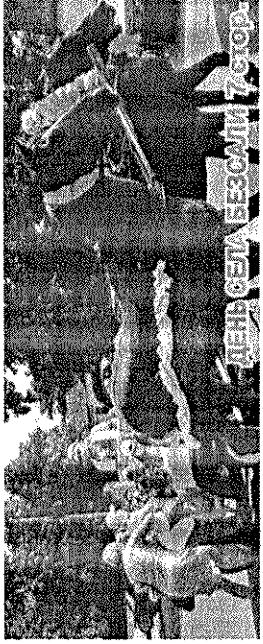
ДЕНЬ СЕЛА БЕЗСАДІ 7 СЕРВ.