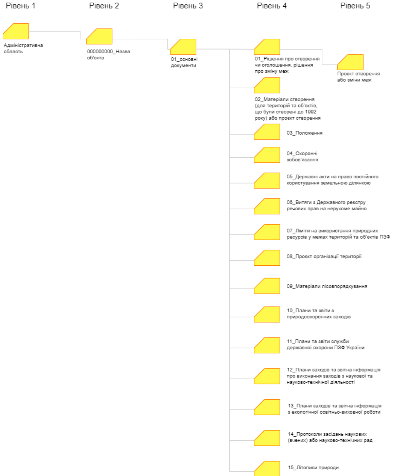
Рисунок 2.4 Структура архіву (до підпункту 3 пункту 6 розділу II цієї Інструкції)